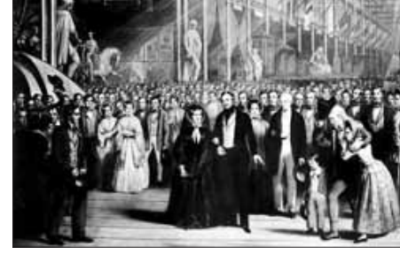
Dieser alte Stich zeigt Königin Victoria mit ihrem Gatten Prinz Albert bei der Eröffnung der ersten Weltausstellung im Jahr 1851.

Als berühmtester Bau seiner Zeit und wohl elegantestes Ausstellungshaus überhaupt darf Mies van der Rohes Barcelona-Pavillon gelten, der heute wieder als Replik zu bewundern ist. Das Haus irritiert, weil es gar nicht als Haus gedacht ist, sondern als Tempel. Sind es nun die kostbaren Materialien einschließlich dieser sagenhaften Wand aus Onyx, jene frivole Askese, verschwenderisch mit Raum umzugehen und kaum etwas zu zeigen außer Stimmung? Oder sind es die irrwitzig verfließenden Räume? Jedenfalls schafft der Wechsel aus Ausblicken und geschlossenen, den Blick in bestimmte Richtungen zwingenden Achsen eine Ästhetik der Härte und Unbedingtheit, wie sie nur wenige Häuser erreichen. Barcelona bildet einen Endpunkt, unendlich weit ent-